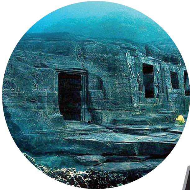
Yonaguni, la misteriosa ciudad sumergida de Japón