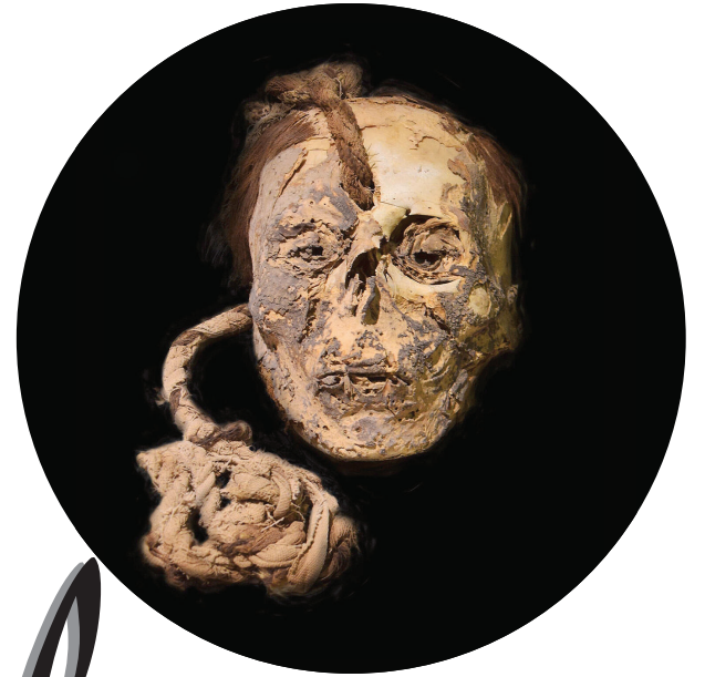
Hallan en Perú las pruebas más antiguas del uso de drogas psicodélicas en rituales humanos